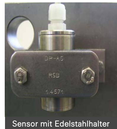
Sensor mit Edelstahlhalter