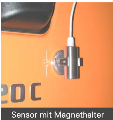
Sensor mit Magnethalter

Die kleinere Zahl oben im Display gibt die Luftausserentemperatur an. Die grössere Zahl unten im Display zeigt die Strassenoberflächentemperatur. Unterhalb 3^{\circ}\text{C} erscheint ein Warnlicht im Display.