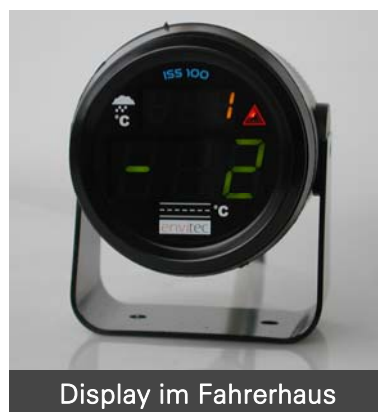
Display im Fahrerhaus